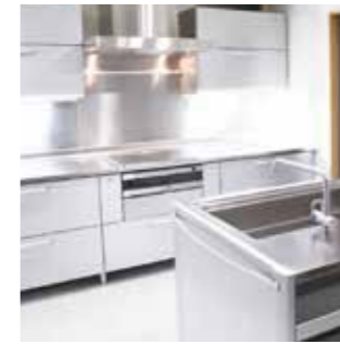
キッチン周りのベト付きに

ご家庭の住居汚れはもちろん、トイレやバス周り、洗面台等の汚れにもご使用ください。