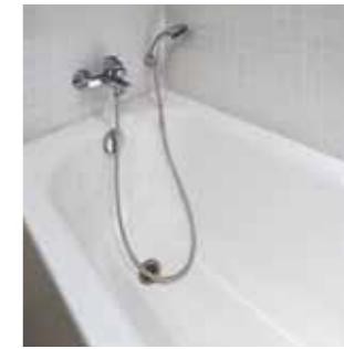
浴室の湯垢・黒ずみに